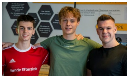
Elever fra HHX til DM i Erhvervs-case

PÅ TRADIUM HANDELSGYMNASIET bliver du en del af et stort og moderne gymnasium med over 850 elever. Du får et inspirerende uddannelsesmiljø med mange muligheder og minder for livet.