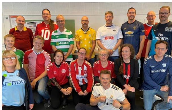
Undervisere på #FodboldtrøjeFredag

Som elev på HHX har du også mulighed for at dyrke fitness og sport i helt nye sportsfaciliteter i den såkaldte "Toolbox". Du skal bare have et Tradium-studiekort – så har du gratis adgang alle hverdage!