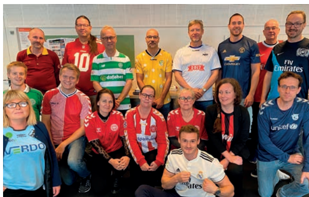
Undervisere på #FodboldtrøjeFredag

Som elev på HHX har du også mulighed for at dyrke fitness og sport i helt nye sportsfaciliteter i den såkaldte "Toolbox". Du skal bare have et Tradium-studiekort – så har du gratis adgang alle hverdage!