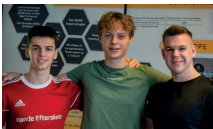
Elever fra HHX til DM i Erhvervsfase